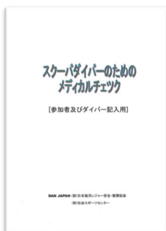
【参加者及びダイバー記入用】