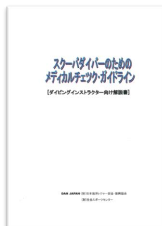
【ダイビングインストラクター向け解説書】